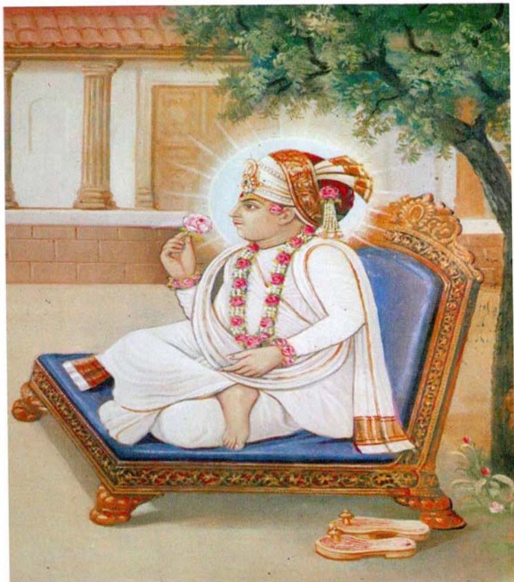
सर्वोपरी उपास्य मूर्ति पूर्ण पुरुषोत्तम श्री स्वामिनारायण भगवान्